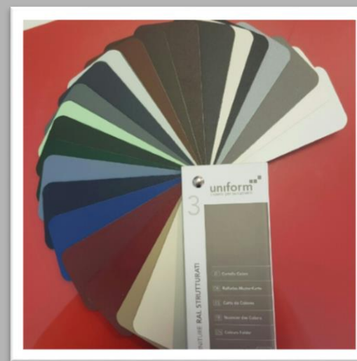
SU RICHIESTA: finiture RAL strutturati