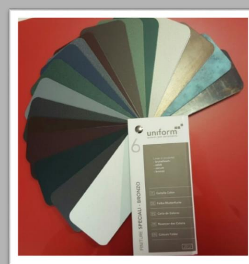
SU RICHIESTA: speciali bronzo