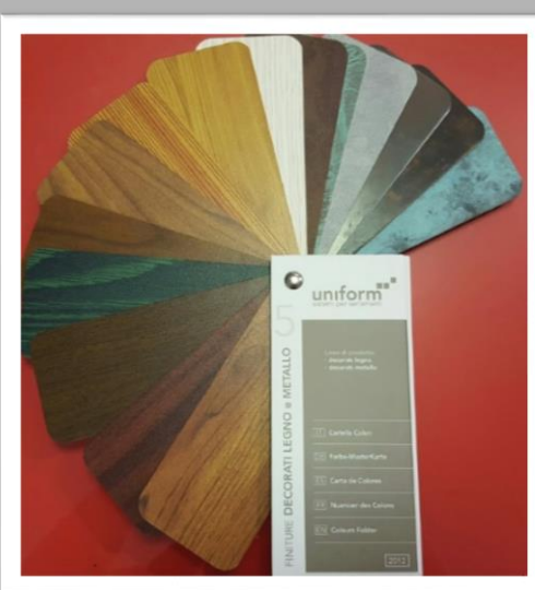
SU RICHIESTA: decorati legno e metallo