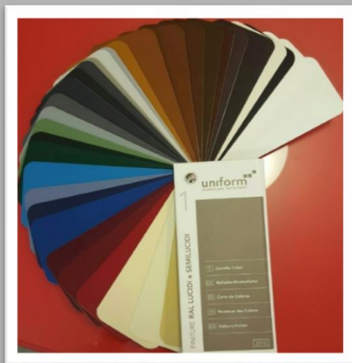
STANDARD: finiture RAL lucidi e semilucidi

I colori di scelta sono disponibili da nostro CAMPIONARIO USFA. Una vasta gamma di finiture: