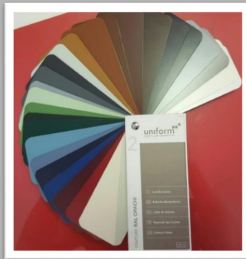
STANDARD: finiture RAL opachi