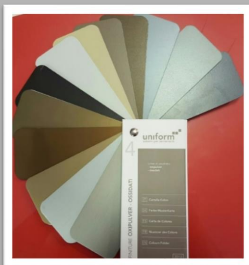
SU RICHIESTA: oxipulver ossidati